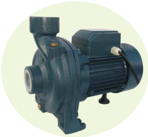
BGm1A (1.0 HP)